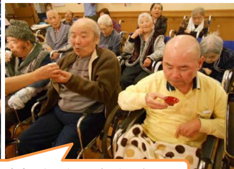
今年も良い年になりますように★